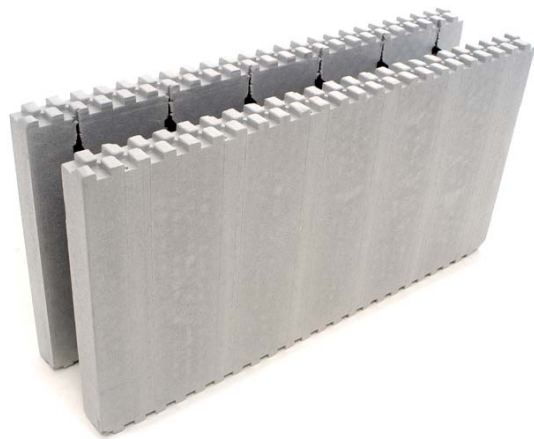
Bild 1 Standardelement