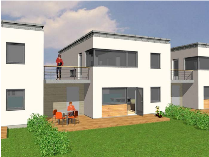
Bild 7 kedjehus, inspiration