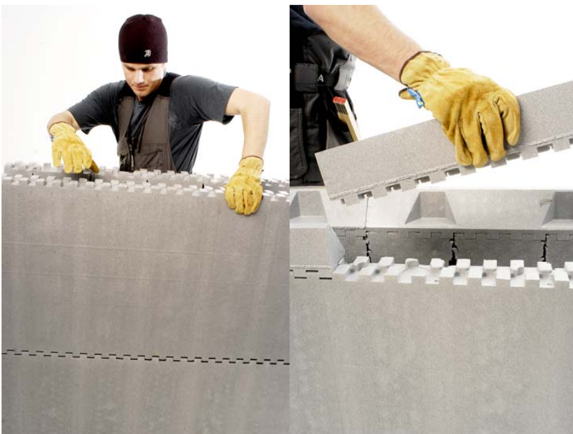
Bild 6 Montering