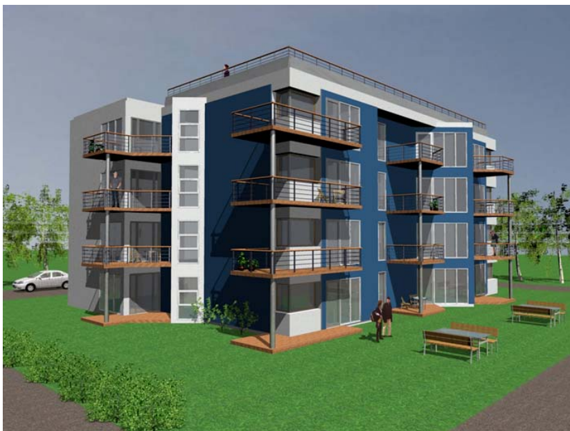
Bild 8 flervåningshus, inspiration