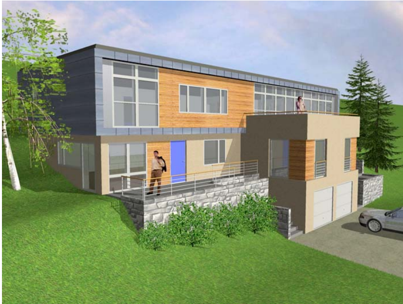
Bild 9 funkishus med källare, inspiration