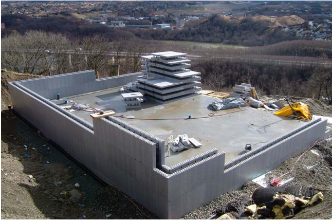
Bild 4 Byggarbetsplats