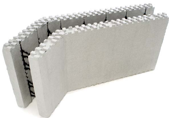
Bild 3 Hörnelement 45